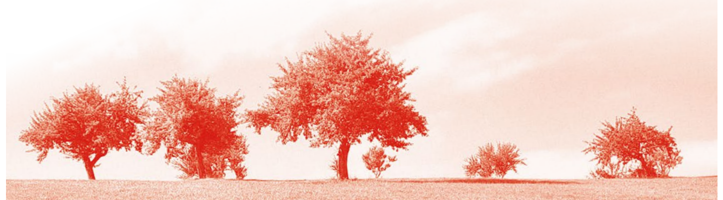
Ein Obstbaum für Streuobst hat eine Stammhöhe von mindestens 160 Zentimetern. Die Ernte erfolgt größtenteils von Hand.

Dieser Frühling war in unserer Region kühl und nass, sodass in der Baumblüte Bestäuber wie z. B. Bienen nicht geflogen sind. Die Folge: Keine Bestäubung, keine Äpfel. Da uns die Förderung von Streuobstwiesen wichtig ist, haben wir deshalb auf Obst von der Schwäbischen Alb zurückgegriffen.